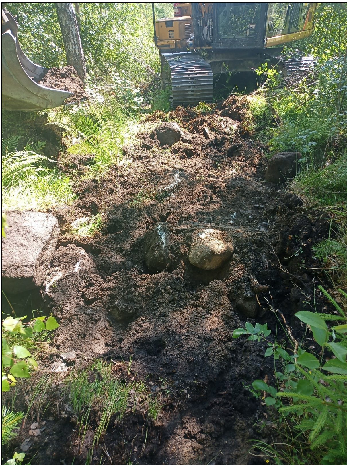
Figur 5. Marken inom utredningsområdet bestod av blockmorän. I varje schakt kom det mycket rikligt med sten eller stenblock direkt under grässvålen.