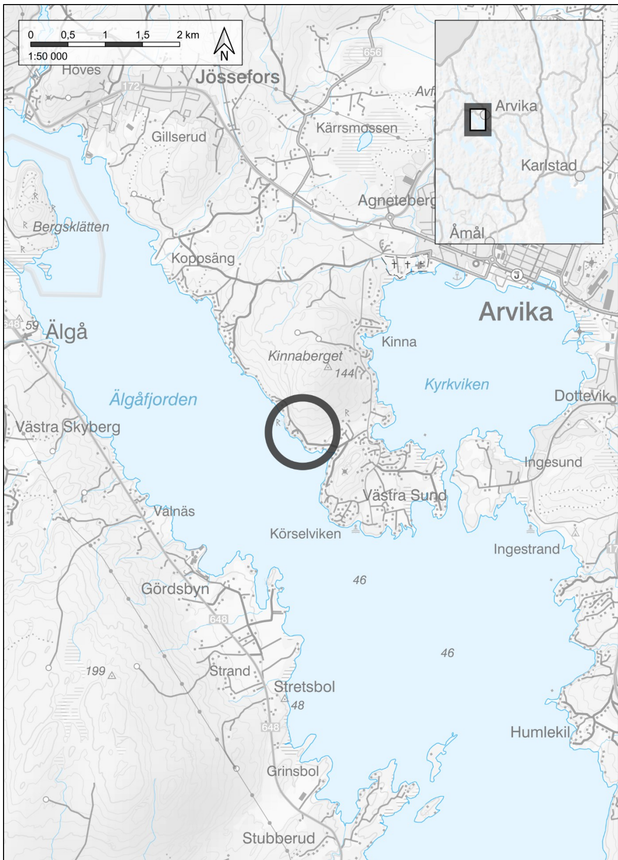
Figur 1. Översiktskarta med platsen för undersökningen markerad med svart cirkel.