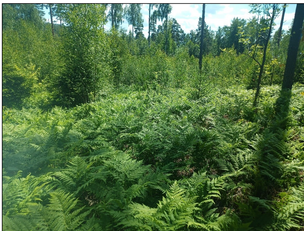
Figur 3. Området består idag av skogbeklädd, stenig moränmark. Den västra delen av utredningsområdet är idag en föryngringsyta med sly. Den östra delen av utredningsområdet består av uppväxt skog.