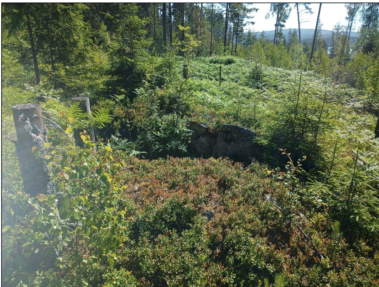
Figur 6. Hällkistan L2007:58 liksom hällkistan L2007:286 cirka 50 m åt sydväst är båda belägna i blockmorän, men i ett annat topografiskt läge, i sydsluttningen mot dalgången mellan Alviken och Djupviken.